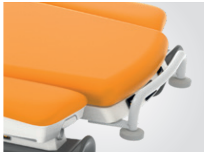
Barre de brancardage