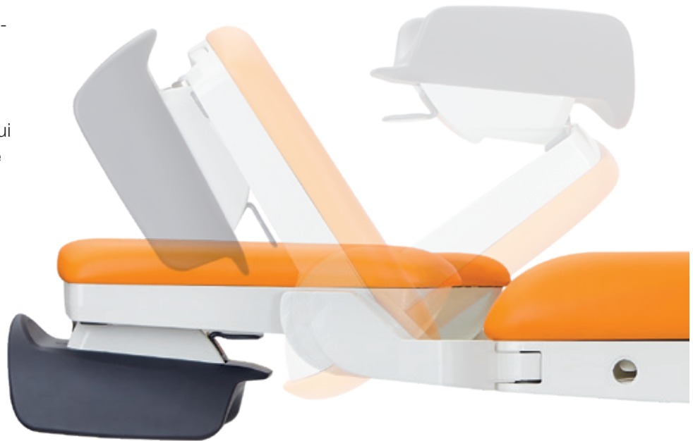
Réglage rapide des repose-jambes.

L'amplitude des axes de positionnement des repose-jambes permet à l'équipe soignante de répondre très rapidement et efficacement aux différentes situations qui peuvent se produire lors de l'accouchement.