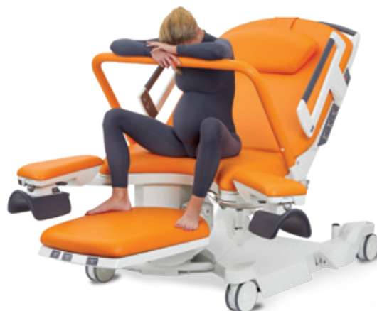
Assise, accoudée à la barre