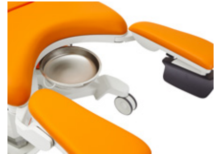
Sliding stainless catch basin 4.5l