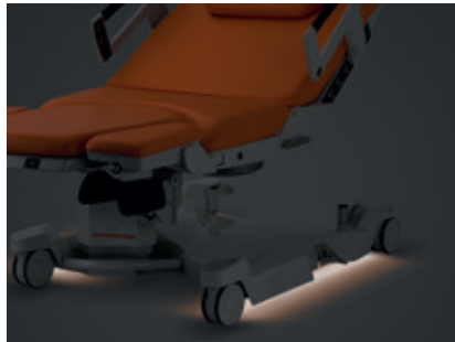
Veilleuse de nuit