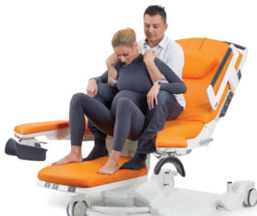
Semi-assise avec l'aide de son partenaire