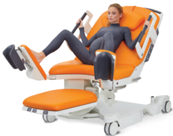
Position gynécologique active avec les pieds sur les repose-jambes