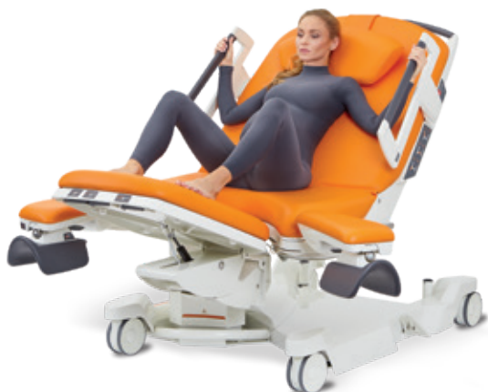
Semi couchée avec les pieds sur la section jambière