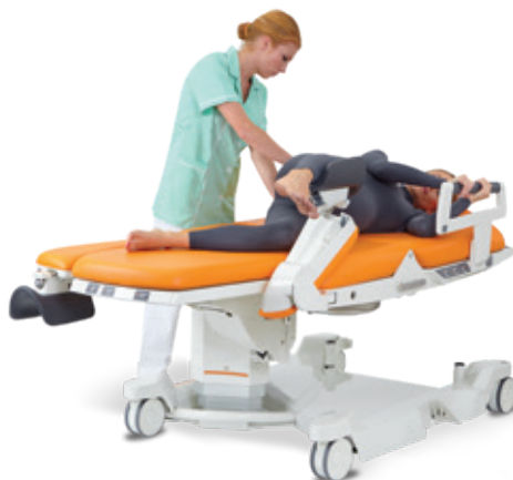
Couchée sur le côté