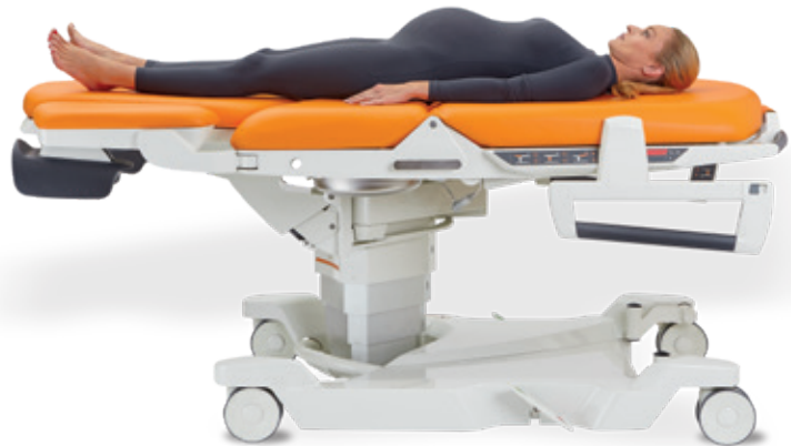
Remise à plat d'urgence du relève buste