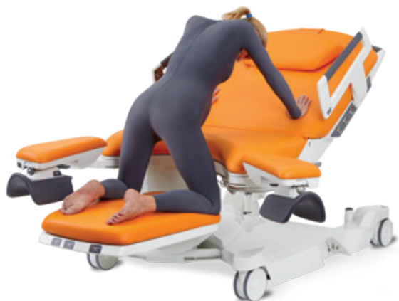
A genoux en appui sur bras