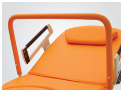
Barre de suspension