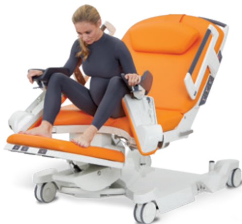
Semi-assise en appui sur les repose-jambes