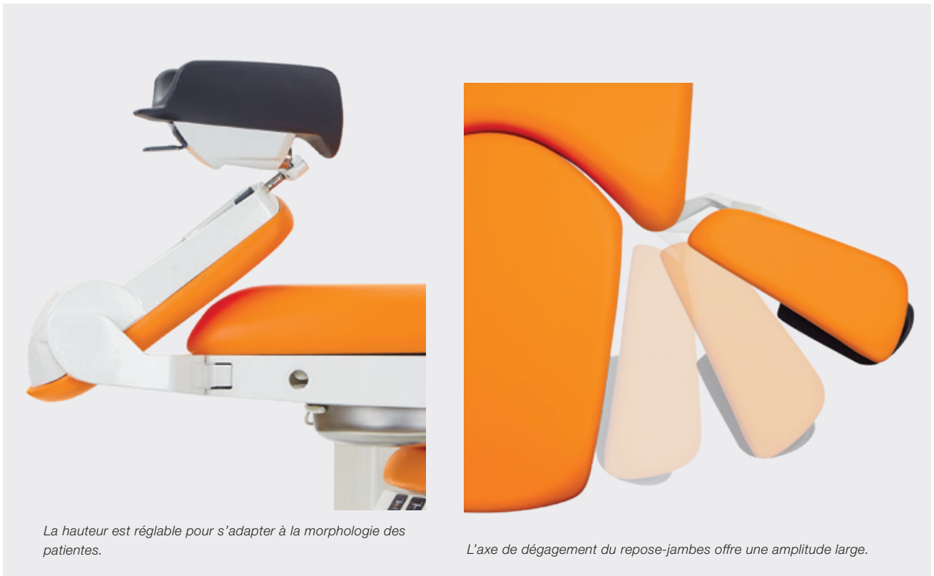
La hauteur est réglable pour s'adapter à la morphologie des patientes.