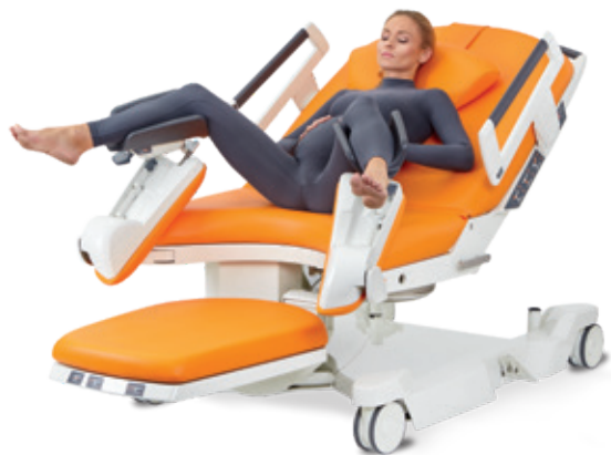
Position gynécologique passive