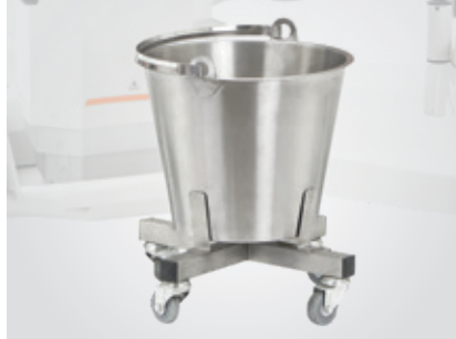
Seau à placenta sur roulettes