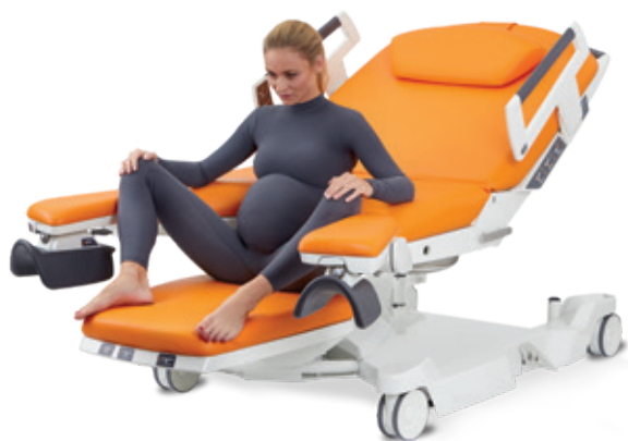
Semi-assise sur la section jambière