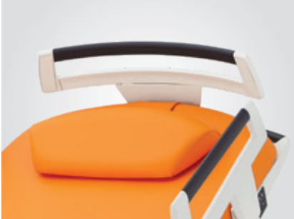
Tête de lit amovible